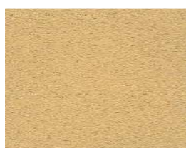
RUSTICO FINE da utilizzare nelle zone agricole