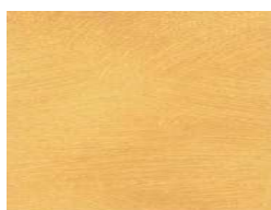
VELATURA da utilizzare nelle ZTO A/B/C/D