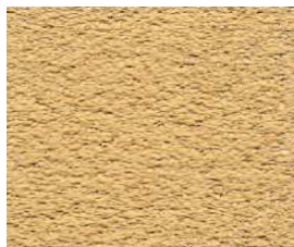
RUSTICO da utilizzare nelle zone agricole