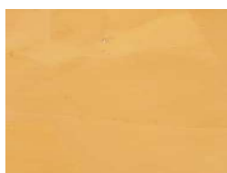
LISCIO SPATOLA da utilizzare nelle ZTO A/B/C/D