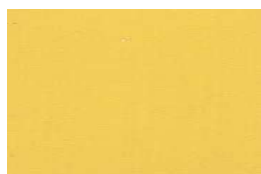
COPRENTE da utilizzare nelle ZTO A/B/C/D