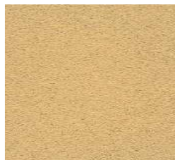
RUSTICO MEDIO da utilizzare nelle zone agricole